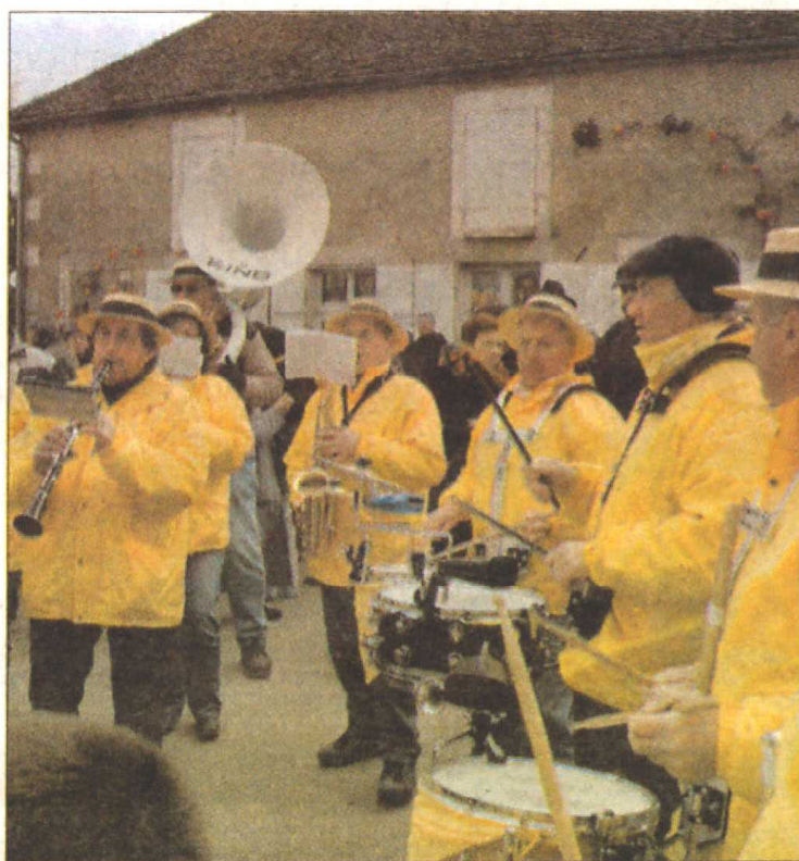
Au détour d'une rue, la Banda romanaise assure l'ambiance plus grand plaisir des visiteurs.