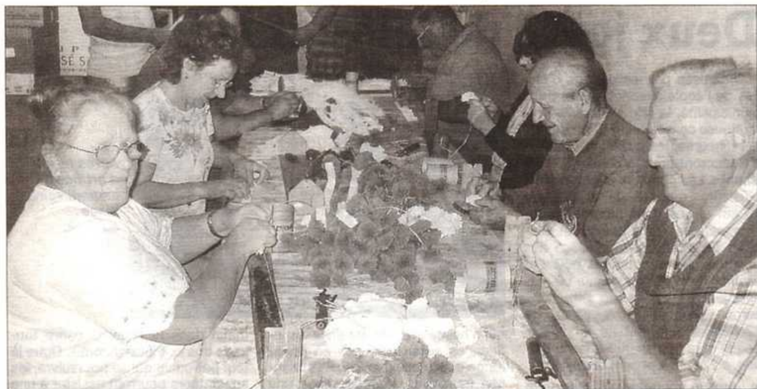
Les « irréductibles », au travail chez Jean-Marie, préparent activement les décorations pour la future Saint-Vincent tournante.

Alors que d'aucuns ne pensent que soleil et voyages, farniente, baignades, visites, randonnées ou escalades et que beaucoup de vacanciers profitent de ces deux mois d'été pour passer quelques jours de vacances loin de leur terre natale, quelque part en « Icaunie », dans un village perché au sommet d'une colline dominant la vallée du Serein, tout près d'une église vers laquelle convergent les treilles de vigne, un groupe d'habitants irréductibles continue à travailler pour la prochaine Saint-Vincent tournante du vignoble chablisien.