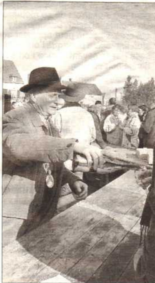
Lignorelles a prêté main-forte aux amis de Villy.