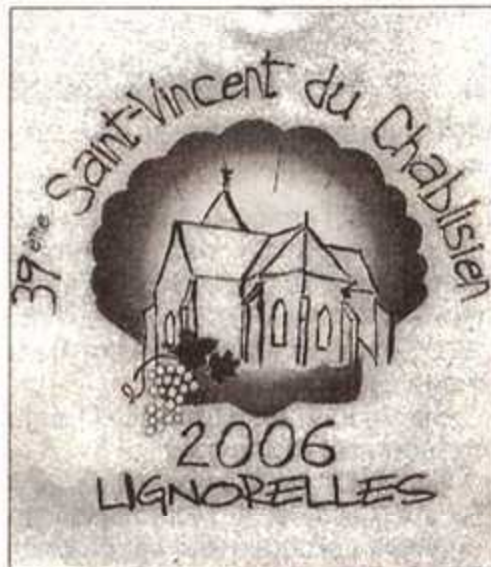
Un logo représentatif du village.